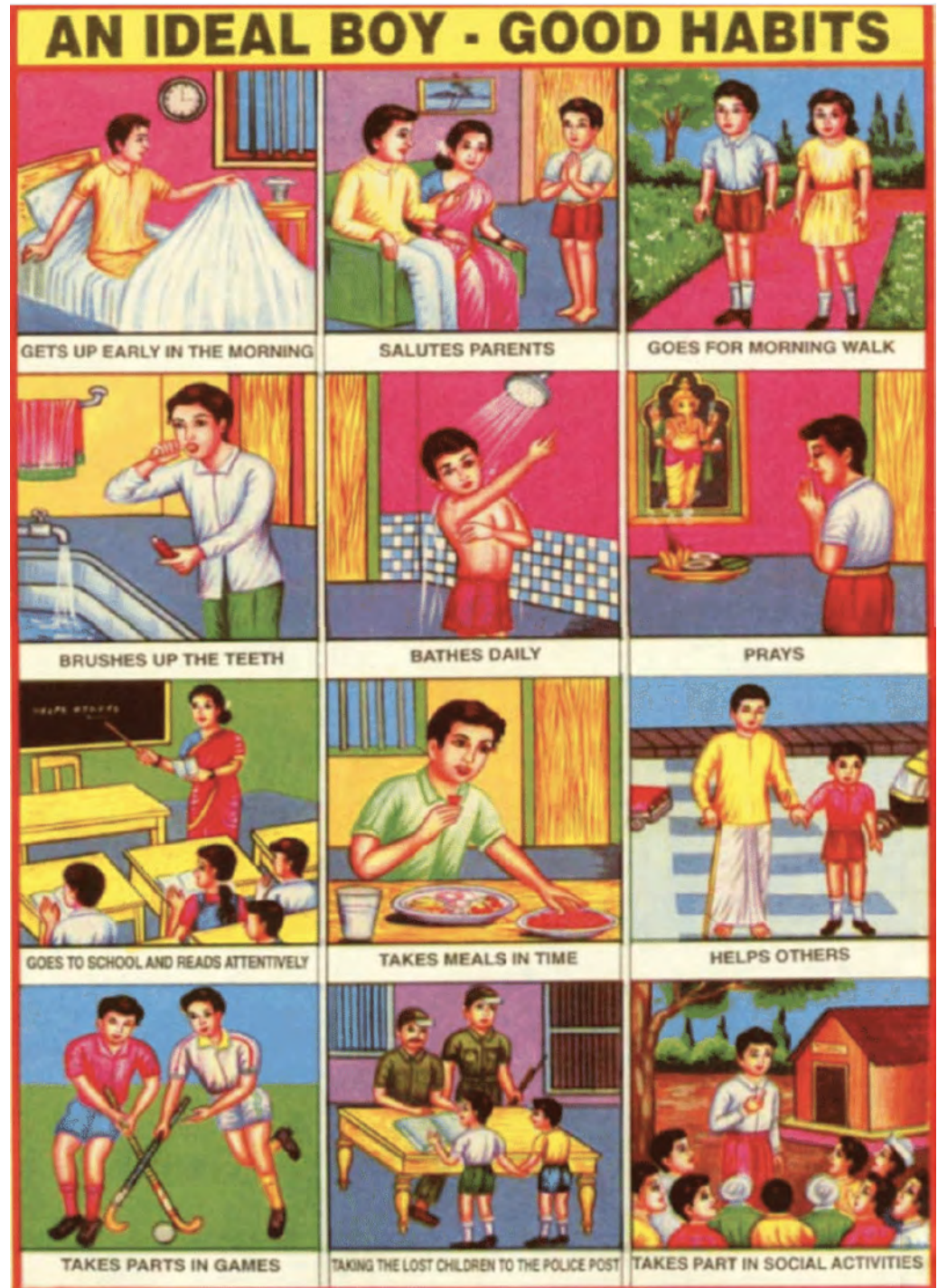
Ideal Boy Good Habits Poster, Multiple publication sources including India Book Depot, Delhi

The semiotic underpinnings of childhood visual language emerged as profoundly resonant again this spring, this time figured within in a series of disintegrating instructional charts stored in plastic packets I uncovered during my seasonal studio tidying. Here are two examples below: