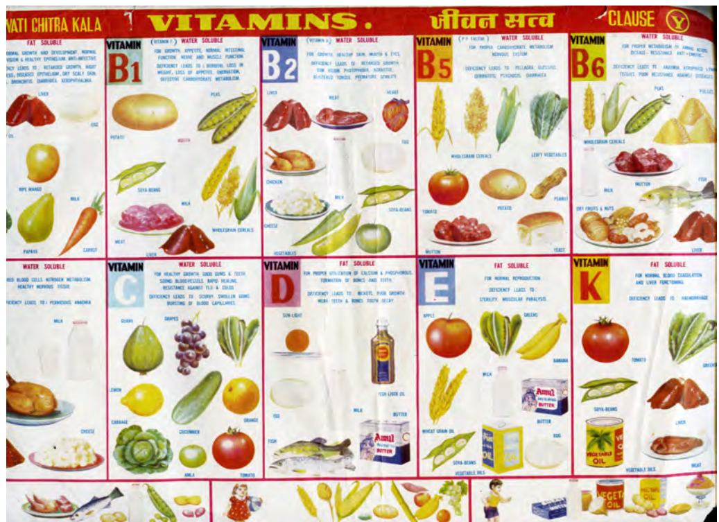
Food Chart, from Artist's Collection