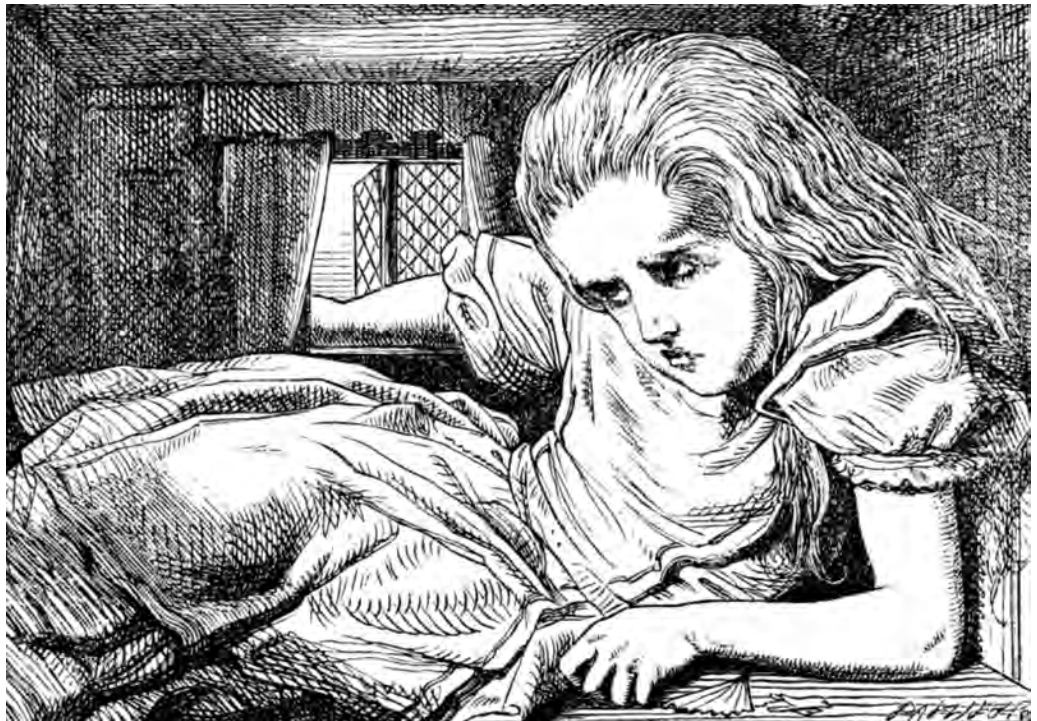
Illustration d'origine (1865), par John Tenniel (28 février 1820 – 25 février 1914), du roman de Lewis Carroll, Alice au pays des merveilles . translation: Illustration by John Tenniel, Alice in the land of dreams , from the novel Alice in Wonderland

Seeing familiar stories through this newfound lens, "Little Red Riding Hood" illustrations came to occupy space on the page as signifiers of sexual violence and a threat to white femininity, both potential and inevitable, lurking in the bedroom, in turn cultivating a fear of the dark, hairy, masculine other. In "Alice in Wonderland," Alice's illustrated transgressions also had profound consequences for her safety and comfort. Ignoring the warning to abstain from drinking, she faces the consequence for breaking this rule with the transformation of herself into a monstrous body that can no longer comfortably exist in a human abode. The edges of her form press up against the walls and the floor, threatening her bodily integrity and imperiling her very existence. In fact, the punishment borne by Alice has been pathologized to such an extent that it bleeds into scientific knowledge, enshrined in the official discourse of mental health: "Alice in Wonderland syndrome"