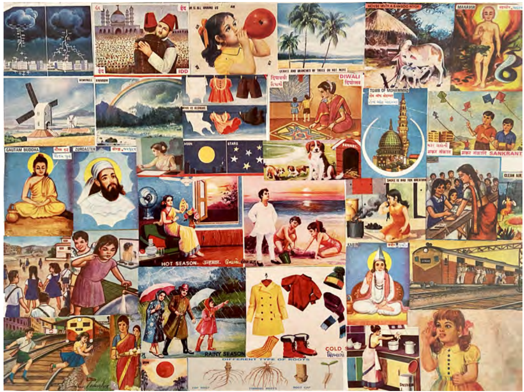
Chitra Ganesh, Collage of chart ephemera fragments