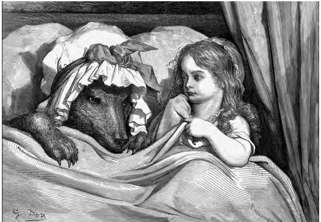
Red Riding Hood in bed with the wolf. Untitled illustration from Les Contes de Perrault , an edition of Charles Perrault's fairy tales illustrated by Gustave Dore, originally published in 1862.