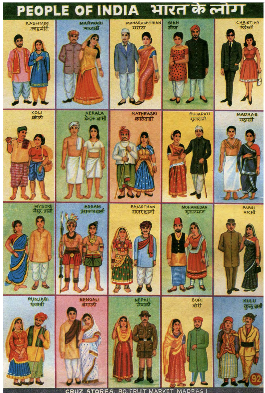
People of India: Cruise Stores, 80, Fruit Market, Madras

Created at the cusp of post-independence India and typically printed using four color offset printing, lithographs, and oleography, these images have been considered for some time as hipster collectors' items, of the urban Indian middle and upper classes, part of a variegated print ecology alongside vintage Bollywood posters, record album covers, matchboxes, and more. In 2001, a sizable compendium of such charts was brought together in The Ideal Boy , a coffee table book marketed to a global art audience that describes the sign system of Indian informational charts as "A uniquely illuminating and hugely entertaining survey of a fascinating Indian phenomenon. These stunning visual charts cover every imaginable subject and are found everywhere throughout India—from roadside booths to large shops. Intended primarily as educational material, they also act as guides to morality and correct social behavior and offer marvelous cautionary tales."